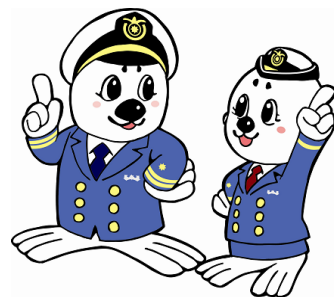
「うみまる」と「うーみん」