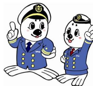
「うみまる」と「うーみん」