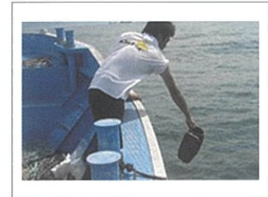
産卵用タコツボの設置