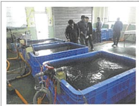
ホシガレイの中間育成(陸上飼育)

左記の各部門の“豊かな海づくり”の活動に永年にわたって貢献し、その功績が顕著であった団体等に対し、大会会長賞、農林水産大臣賞、環境大臣賞、水産庁長官賞を授与し、全国豊かな海づくり大会式典で表彰を行います。