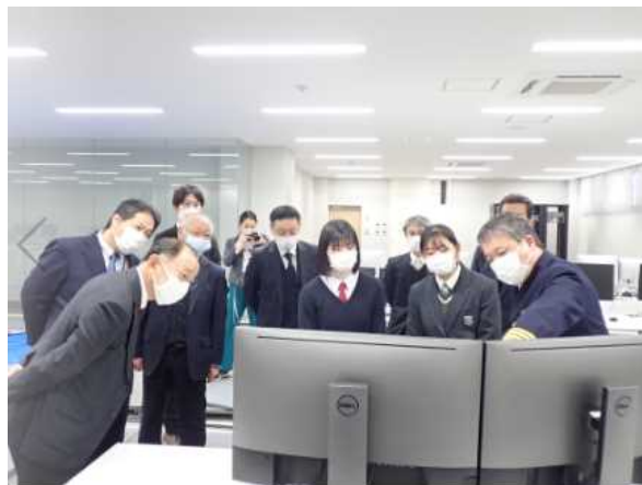
愛称選考委員による施設見学の様子 令和4年12月14日