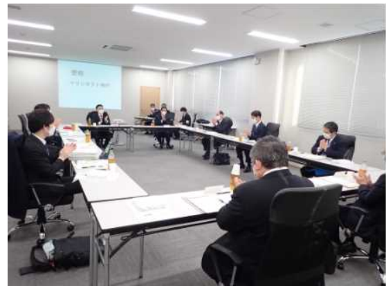
愛称選考会の様子 令和4年12月14日