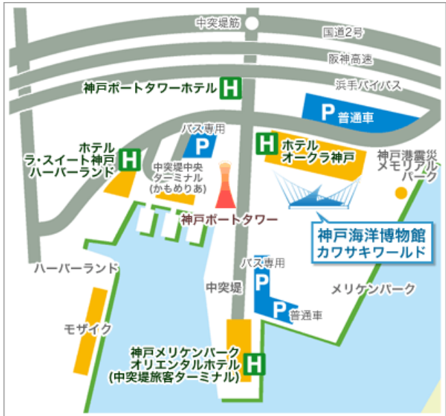
会場案内図