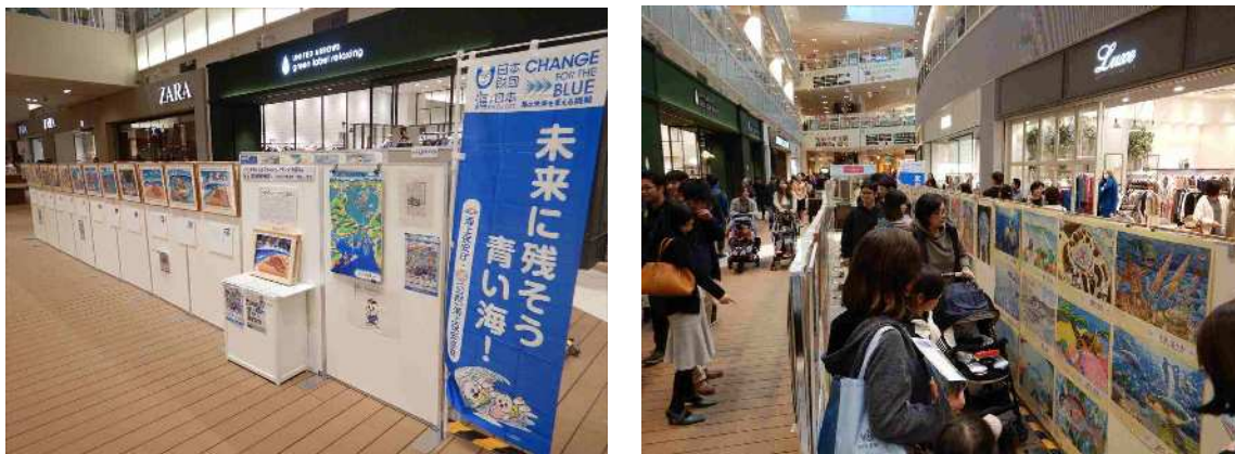
（令和元年 11 月 9～10 日 ららぽーと豊洲にて開催された本庁絵画展）