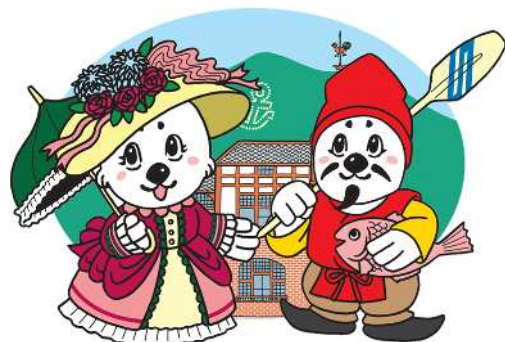
神戸・西宮 ver うみまる・うーみん