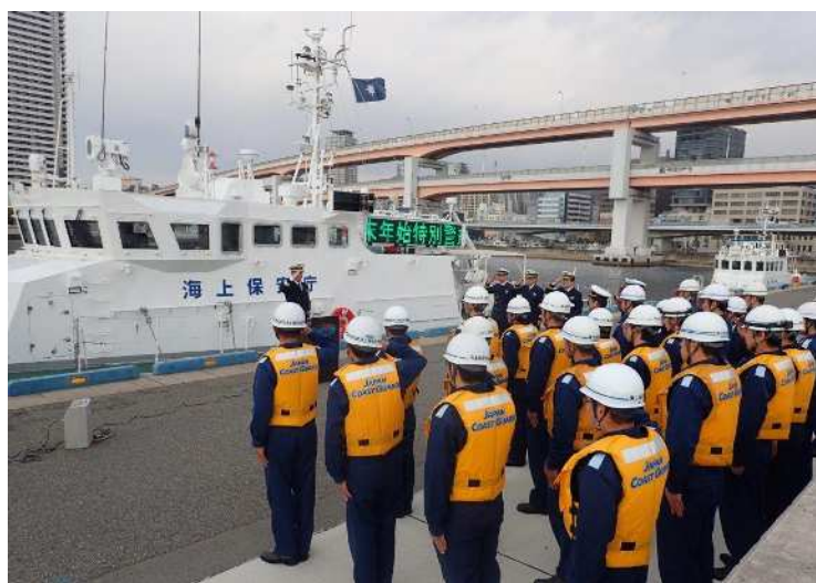
(保安部長による訓示模様)