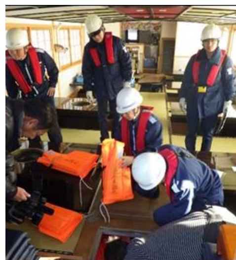
(旅客船内の救命胴衣の点検状況)