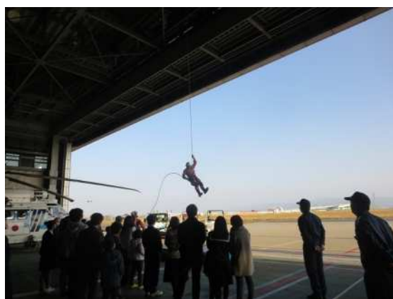
(昨年の見学の様子)