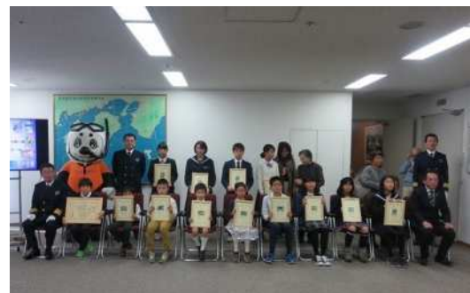
( 昨年の表彰式の様子 )