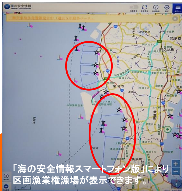
「海の安全情報スマートフォン版」により区画漁業権漁場が表示できます。