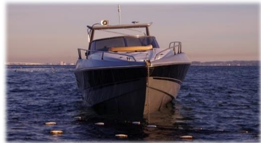
【乗揚げたプレジャーボート】