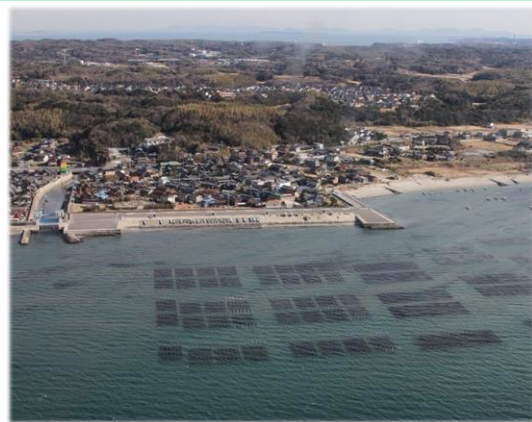
【のり網の設置状況】