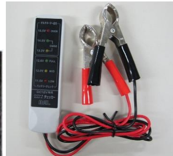
例) バッテリーチェッカー 1,000円程度