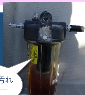
真っ黒に汚れたフィルター