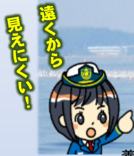
養殖海苔網施設写真

沿岸部に海苔網が設置されており、暗くなるほど視認が困難です！ 以前航行できた海域でも海苔網が設置され、乗揚げの危険があります！