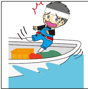
図) 操業中の漁船各種事故 (病気を除く)