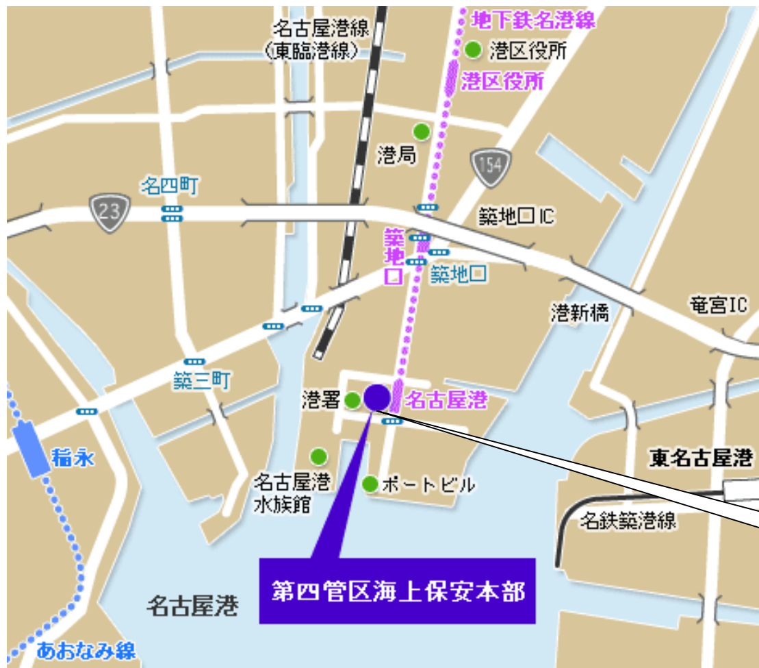
(参考)名古屋市営地下鉄線図