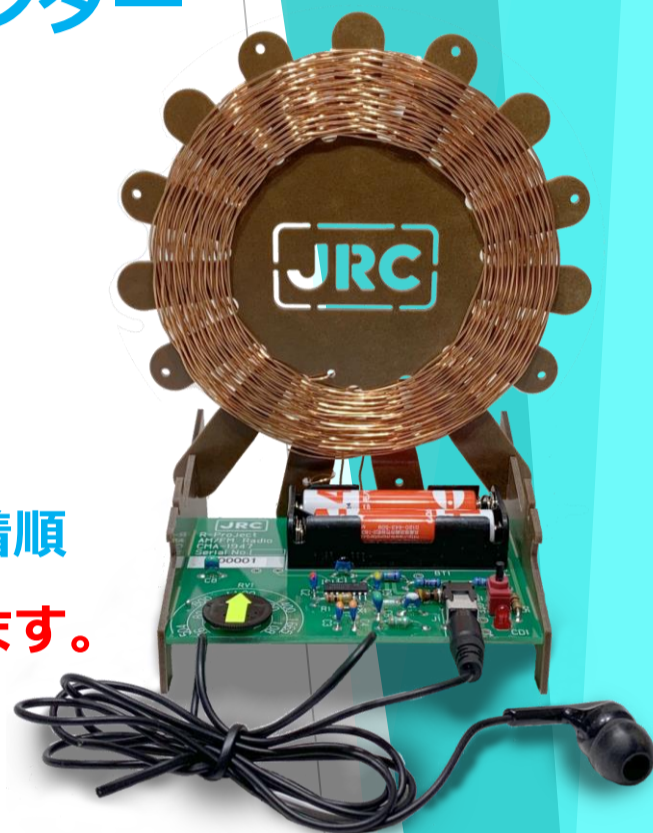
ワイドFM対応 AM/FMラジオ ラジオはもらえるよ！