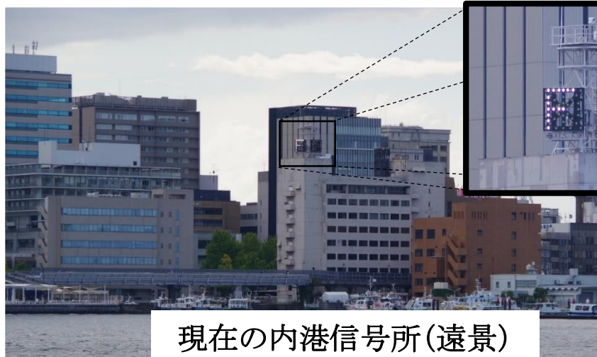
現在の内港信号所(遠景)