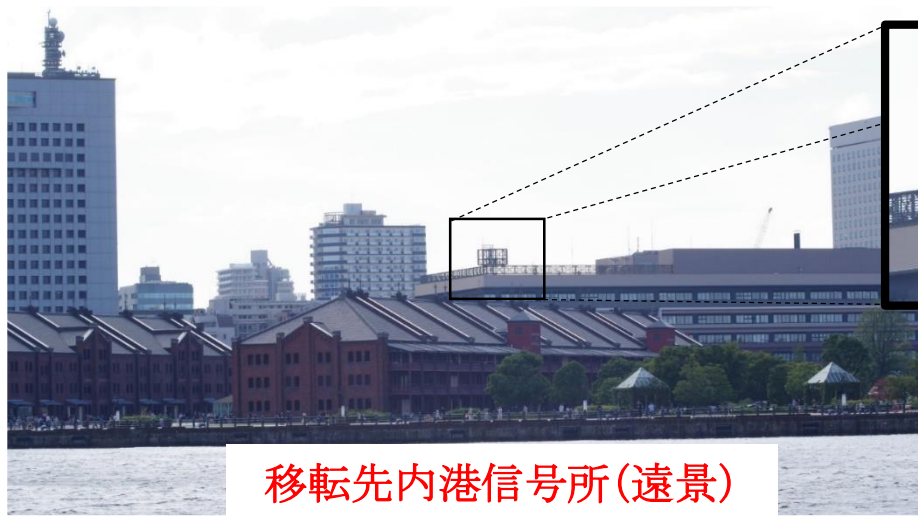
移転先内港信号所(遠景)

工事期間: 令和5年(2023年)12月02日09:00~12月10日まで(予定)