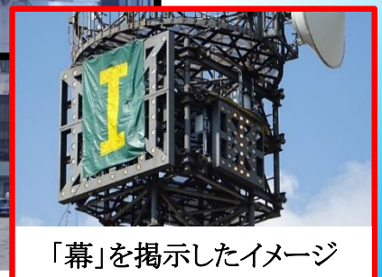
「幕」を掲示したイメージ