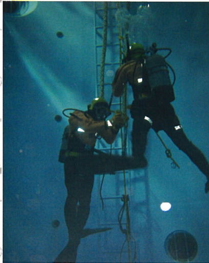
B水槽（潜水訓練用） Water Training Tank B