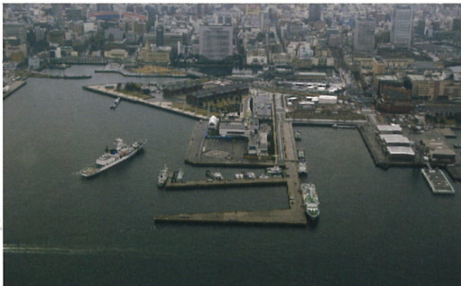
横浜海上防災基地全景 A Complete View of Yokohama Maritime Disaster Prevention Base