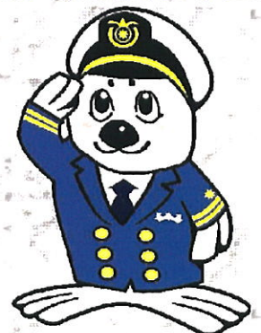
海上保安庁 イメージキャラクター 『うみまる』