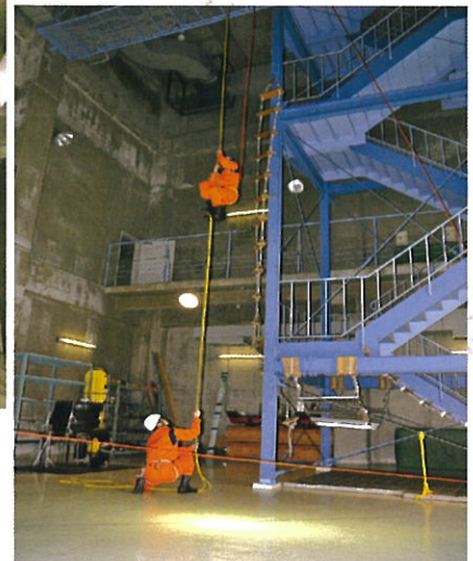
模擬船室 Simulation Room