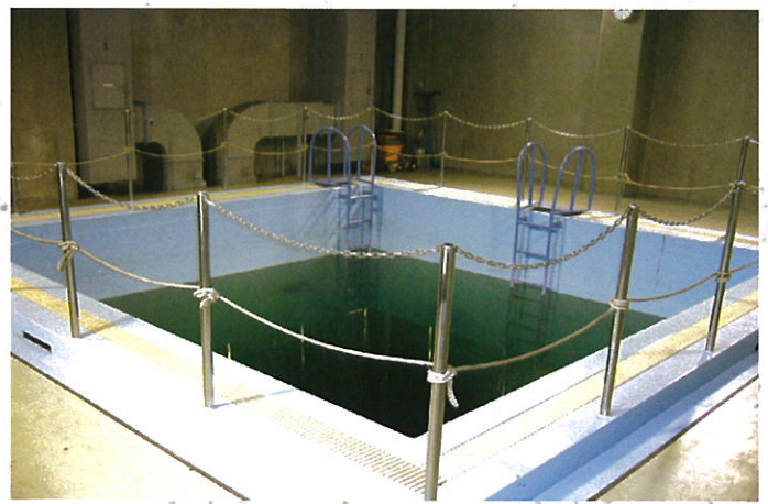
C水槽（水中作業用） Water Training Tank C