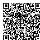
竜巻発生確度ナウキャスト

※「気象情報」「雷注意報」「竜巻注意情報」は海岸線からおおむね20海里までが対象です。各情報の発表区域の沿岸域においてもこれらの情報に注意してください。