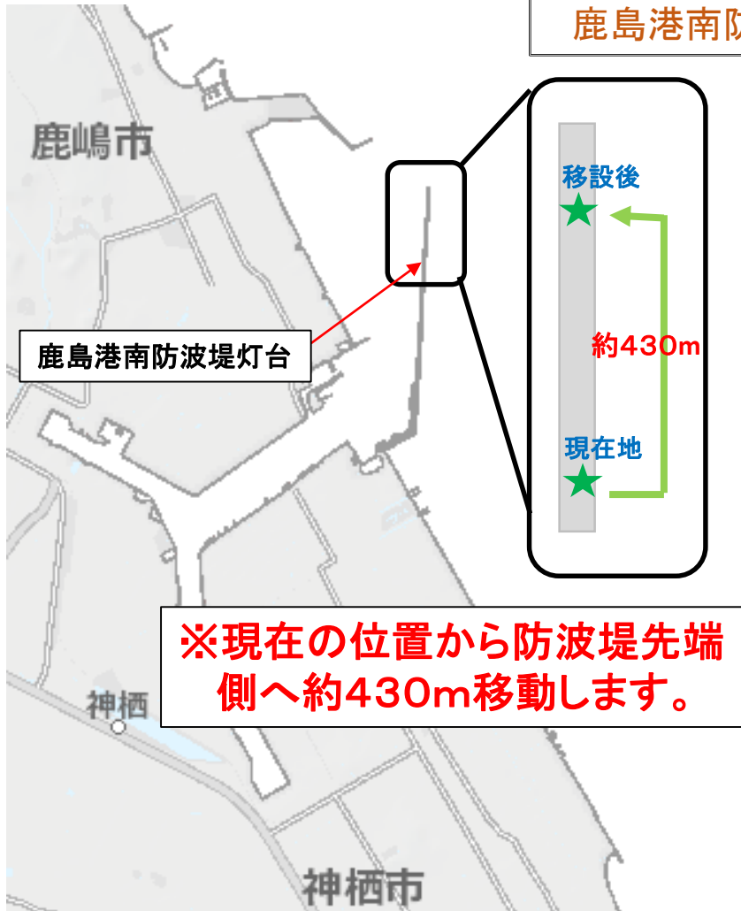
鹿島港南防波堤灯台の全景

鹿島港南防波堤灯台は、南防波堤の延伸に伴い以下のとおり変更しましたのでお知らせします。