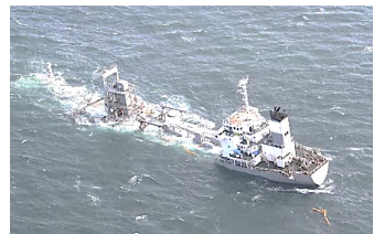
大根へ乗揚げた船舶

おきのたかね 仙台塩釜港沖の暗礁(沖ノ高根(水深2.7m)、大根(水深2.2m))による乗揚げ事故が発生しています。 事故防止のため標識位置等を変更しますので、航行する船舶はご注意願います。