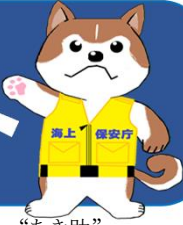
秋田海上保安部イメージキャラクター「あき助」

発行：秋田海上保安部 〒011-0945 秋田市土崎港西1-7-35 TEL 018-845-1621 FAX 018-846-0095 秋田海上保安部ホームページ→