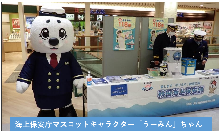
海上保安庁マスコットキャラクター「うーみん」ちゃん