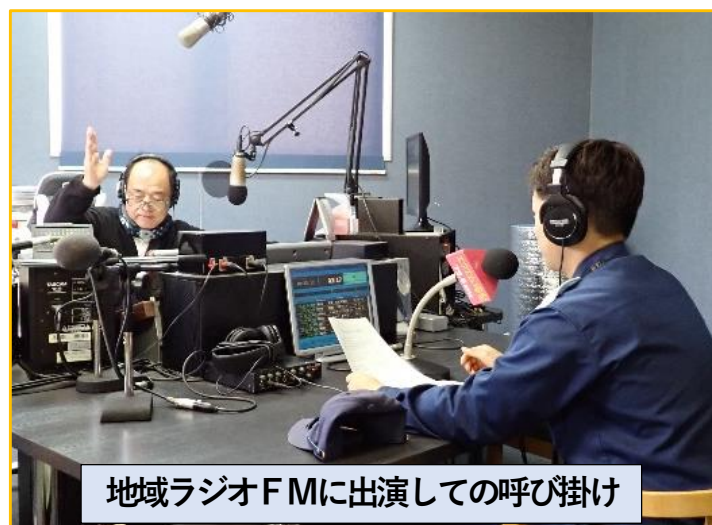
地域ラジオFMに出演しての呼び掛け