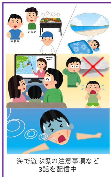
海で遊ぶ際の注意事項など3話を配信中

紙芝居のようにビジュアル化したことで、よりイメージしやすく、身近な危険と捉えやすくなることが期待されます。誰でもダウンロードして海浜事故防止の講習会等に使えるので夏休み前の小中学校等でも気軽に活用してもらえよう、教育委員会等関係機関への紹介も行っていく予定です。