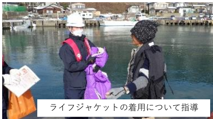
ライフジャケットの着用について指導

さて、海での事故防止につきまして、マリネットをはじめ様々なツールやパトロールを通して海中転落などの事故防止の呼びかけ・指導を行っており、昨年は特にゴールデンウィークやレジャーシーズン、磯釣り・ハタハタ釣りのシーズン中を重点的に海難防止活動を実施してきました。