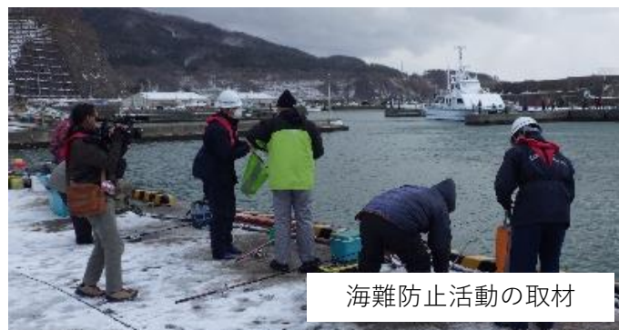
海難防止活動の取材