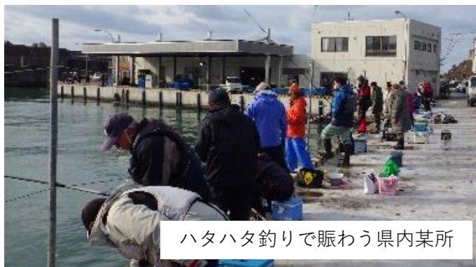
ハタハタ釣りで賑わう県内某所