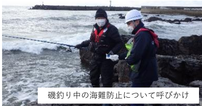
磯釣り中の海難防止について呼びかけ