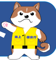
秋田海上保安部イメージキャラクター “あき助”