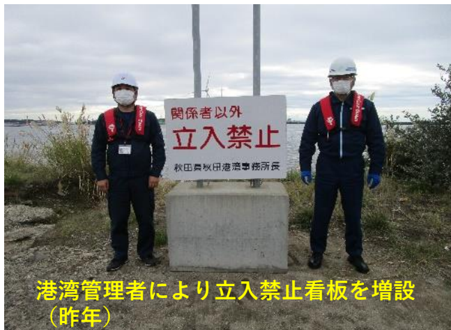
港湾管理者により立入禁止看板を増設（昨年）