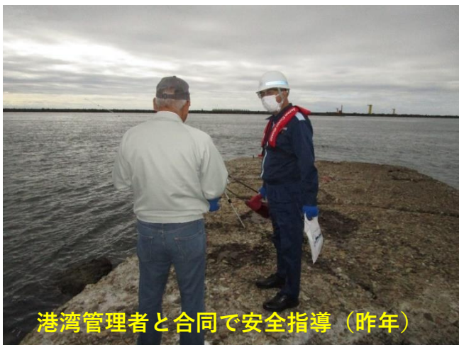
港湾管理者と合同で安全指導（昨年）