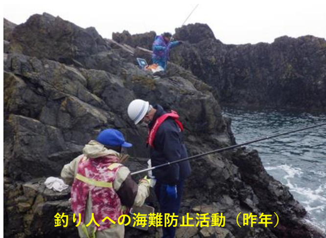
釣り人への海難防止活動（昨年）