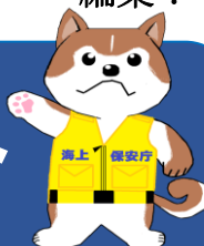
秋田海上保安部イメージキャラクター「あき助」