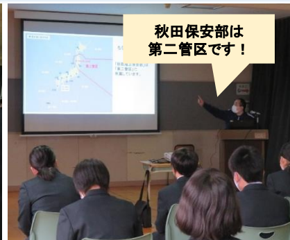
秋田保安部は第二管区です!