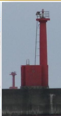
能代港南防波堤灯台(廃止)

令和3年11月6日、能代港南防波堤灯台(赤灯台)を能代港第二北防波堤へ移設しました。