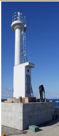
能代港第二北防波堤灯台(移設)