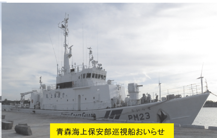
青森海上保安部巡視船おいらせ