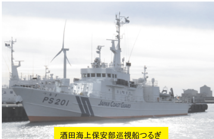
酒田海上保安部巡視船つるぎ