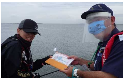
リーフレット配布