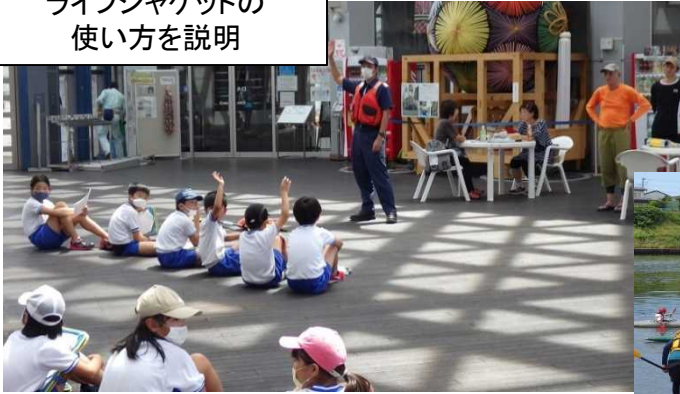
ライフジャケットの 使い方を説明