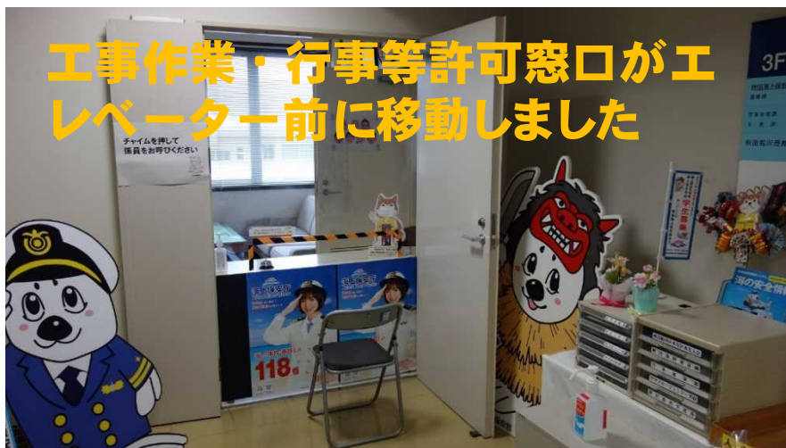
工事作業・行事等許可窓口がエレベーター前に移動しました