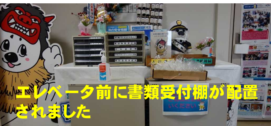
エレベータ前に書類受付棚が配置されました