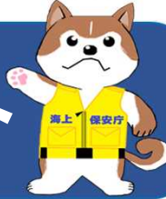
秋田海上保安部イメージキャラクター “あき助”

発行：秋田海上保安部 〒011-0945 秋田市土崎港西1-7-35 TEL 018-845-1621 FAX 018-846-0094