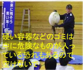
硬い容器などのゴミは中に危険なものが入っている恐れもあるので空けないで

子供達は海岸に流れ着いたゴミを見て、「中国や韓国からのゴミがあるということは逆に海にゴミを捨てると外国に流れていってしまうということ」「マイクロプラスチック※の問題もあり、ゴミは適正に捨てなければいけない」と大人顔負けに環境問題について話してくれました。