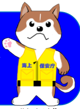
秋田海上保安部イメージキャラクター “あき助”

発行:秋田海上保安部 〒011-0945 秋田市土崎港西1-7-35 TEL 018-845-1621 FAX 018-846-0094