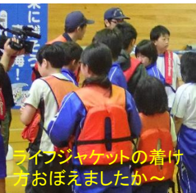
ライフジャケットの着け方おぼえましたか～