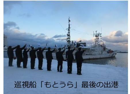
巡視船「もとうら」最後の出港

配属替となった巡視船「さろべつ」は、ウォータージェット推進による高速性能と操縦性能の向上、停船命令等表示装置による情報伝達能力の向上、遠隔放水銃による消火能力や放水規制能力の向上等、海上保安業務全般に渡り対応能力の充実強化が図られており、北海道北部海域における領海警備や海上犯罪の取締り、海難救助等の海上保安業務に従事します。