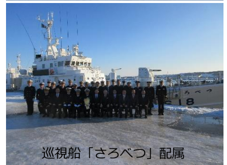
巡視船「さろべつ」配属