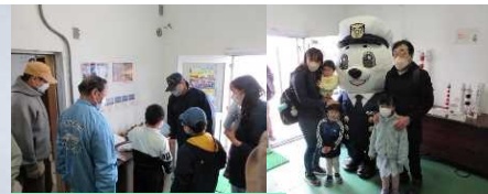
航路標識説明・学生募集案内 うみまると記念撮影

海上保安友の会会員5名の協力を受け、年に1度の稚内灯台一般公開を午前10時から午後3時まで開催し、航路標識の役割説明、118番周知、学生募集、春季海難防止啓発活動を行いました。