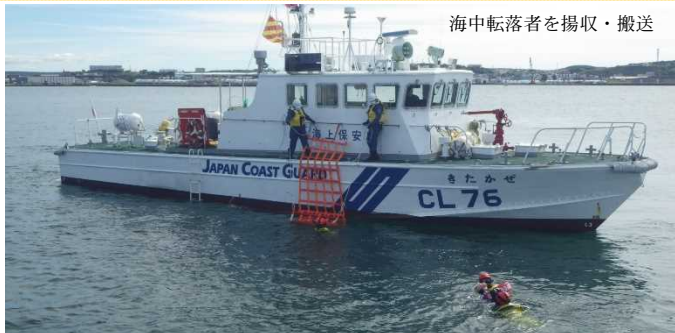
海中転落者を揚収・搬送

8月18日、19日の2日間、稚内港内において稚内警察署及び稚内消防署と共に3機関合同救難訓練を実施しました。