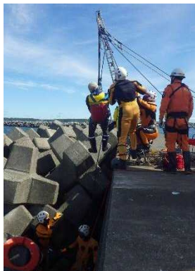
消波ブロックの隙間に落ちた人を救助

本訓練は、大規模海難等への対応を視野に入れた救難体制の相互理解、救助勢力の救助技術の共有及び連携強化を目的とし、各機関は訓練を通じ、それぞれの課題を見つけ、より一層の協力体制の強化を図ります。