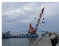
いざ、活躍の舞台へ

抜海漁港の白灯台はこれからも利用者の安全のため、雨の日も風の日も吹雪の日も抜海港北防波堤に立ち続けます。