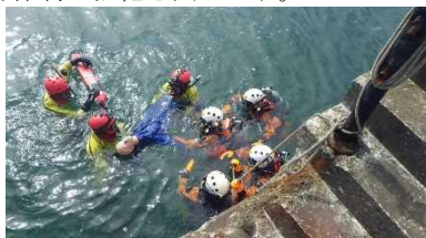
消防潜水班から当部の海面救助員へ救助者を引き継ぎ