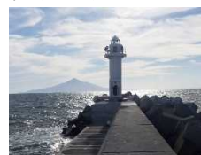
これからは、任せて!