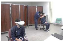
VRゴーグルによる 訓練疑似体験

また、9月8日には浜頓別小学校の宿泊学習の一環で、5年生16人が稚内灯台の施設見学を行いました。