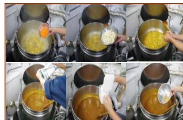
▲チキンカレー作成中