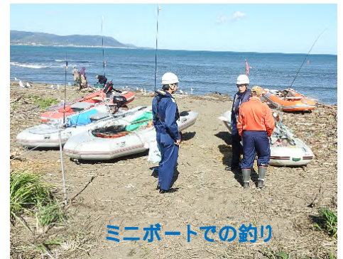
ミニボートでの釣り