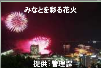
みなとを彩る花火