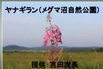
ヤナギラン(メグマ沼自然公園)