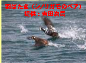
羽ばたき(シロガモのヘア)