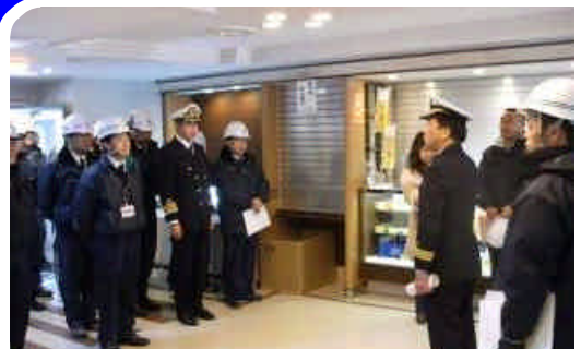
「サイブリア宗谷」船内での講評

総点検を実施したカーフェリーは、ハートランドフェリー株式会社が所有する「サイブリア宗谷」で、 法定書類 、 救命設備 、 消防設備 等の点検や 安全運航 についての指導を行いました。