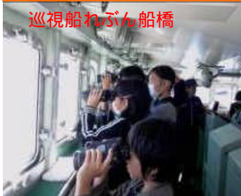
巡視船れぶん船橋