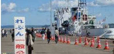
好天に恵まれた れぶん一般公開

9月20日、稚内港北防波堤ドームにて開催された「 日本海V5イカ釣り漁船のふりかえり 」に併せて、 巡視船れぶんの一般公開 を実施し、530名の地元市民の方や観光で訪れた方が見学しました。