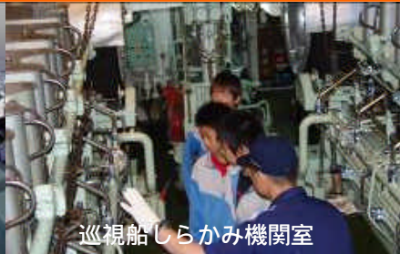
巡視船しらかみ機関室