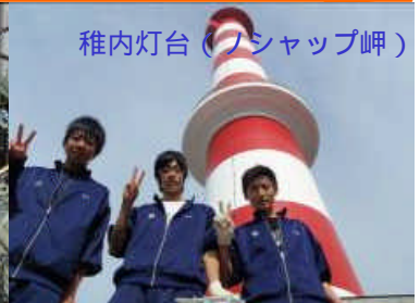
稚内灯台(ワショップ岬)

9月9日・10日と15日・16日にそれぞれ、稚内中学校、稚内南中学校の生徒が 職場体験学習 として、 稚内灯台 や 巡視船しらかみ を見学しました。