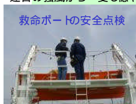
救命ボートの安全点検

救命設備、防火設備などの点検を行うとともに、安全運航の呼びかけや法定書類の検査なども実施しました。