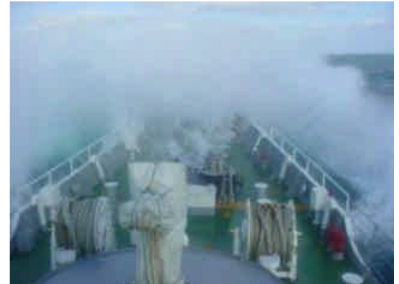
波しぶきを受け航行する巡視船しらかみ