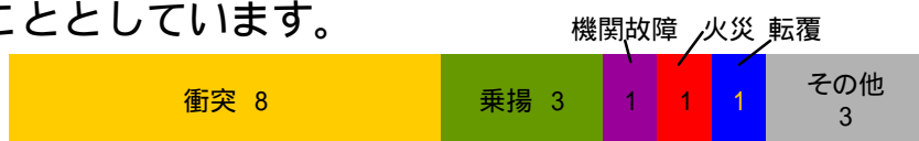
平成18年要救助船舶海難の発生状況(隻)