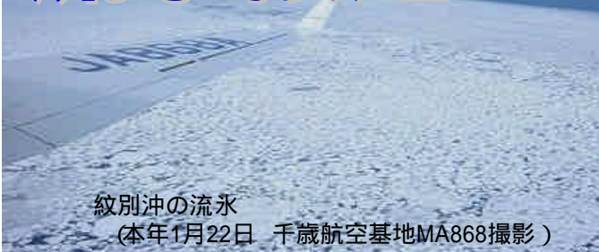
紋別沖の流水 (本年1月22日 千歳航空基地MA868撮影)

1月30日現在、流水は宗谷岬の北東約20キロメートルまで接近しています。付近を航行する船舶は流水の動静にご注意下さい。