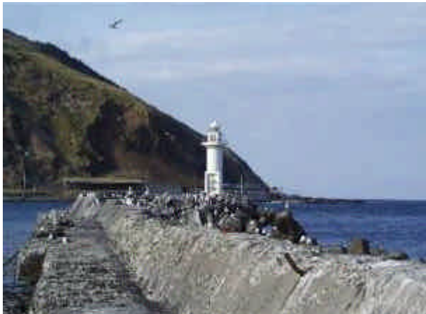
倒壊前の南防波堤灯台

12月19日(月)朝、礼文島香深井港南防波堤灯台が消滅しているのが地元の灯台監視協力者により発見されました。宗谷地方は前日から「暴風雪、波浪警報」が発令されており、低気圧の