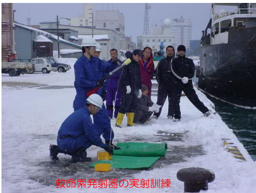
救命索発射器の実射訓練

稚内港では、本年6月に漁船海難防止救済センター全道大会が開催されることもあり、受講者は熱心に安全講話に耳を傾け、また訓練も真剣な表情で行っておりました。