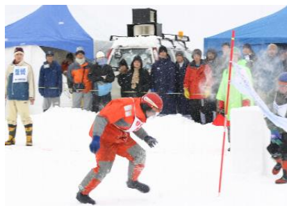
敵陣に攻め込む『海猿チーム』

2月13日（日）、市内で開催された第8回稚内観光協会会長賞争奪「雪合戦」に、巡視船れぶん機動警備隊員の7名が「海猿チーム」として参加。凍りつくような吹雪の中、海猿達は、海上保安庁をアピールするため、オレンジ色の防寒救命衣に身を包み、戦いに臨んだものの、オレンジ色の防寒救命衣は、視界不良の吹雪の中でも非常に目に付きやすいという長所が、雪合戦では相手の標的として格好の餌食になり、善戦虚しく決勝リーグへ進むことはできませんでした。