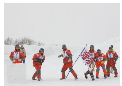
巡視船れぶん機動警備隊員