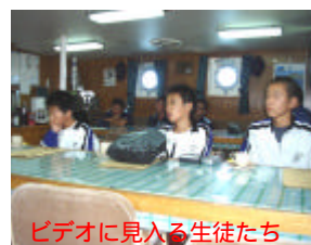
ビデオに入る生徒たち

8月24日(火) 礼文町立船泊中学校2年生3名が、将来の進路選択に役立てようと、職場体験学習で巡視船れぶんを訪れました。当初は緊張し戸惑っていましたが、やさしい海上保安官と接しながら、はじめて見る巡視船の設備に興味を示し、現場第一線で活躍する海上保安官の説明に感銘を受けながらの体験学習となりました。