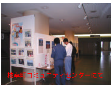
枝幸町コミュニティセンターにて

8月18日(水)～8月20日(金)までの3日間、枝幸町コミュニティセンターにおいて、稚内航路標識事務所と合同で写真パネル展を開催しました。