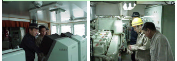
レーダーの取扱実習