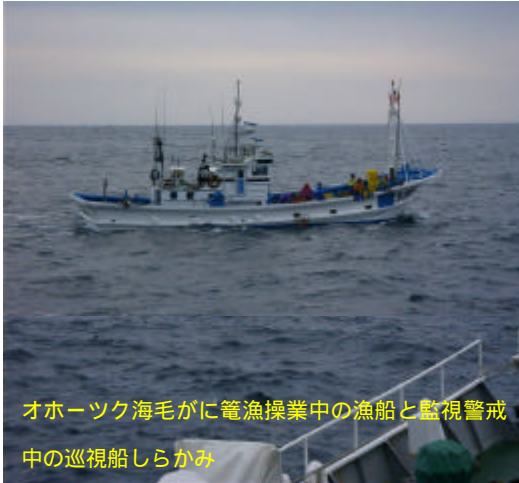
オホーツク海毛がに籠漁操業中の漁船と監視警戒中の巡視船しらかみ

未だ、凍てつく寒風が吹きさぶ最北の海が待望の海明けを迎えた。15日オホーツク海毛がに籠漁の解禁に併せ、ホタテやナマコ漁の沿岸漁業が始まり、冬期間、静まりかえていた管内の漁港が一気に活気づいた。稚内海保では地域・漁協など関係者の要請に応え、昨年に引き続き、毛がに籠漁具被害・海難ともにゼロを目指して巡視船による監視・警戒態勢を強化した。