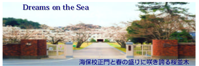
Dreams on the Sea