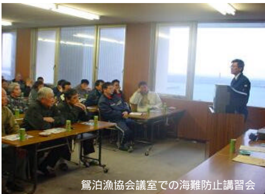
鵜泊漁協会議室での海難防止講習会

去る17日、利尻島鵜泊漁協会議室にて、漁協組合員に対する海難防止講習会を実施した。