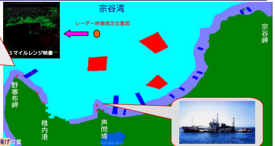
レーダー映像推定位置図