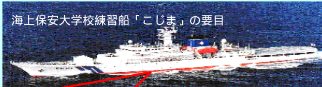
海上保安大学校練習船「こじま」の要目