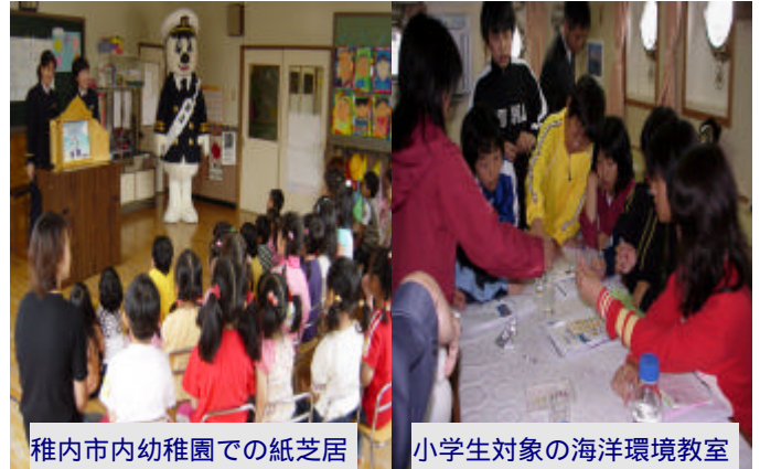
稚内市内幼稚園での紙芝居