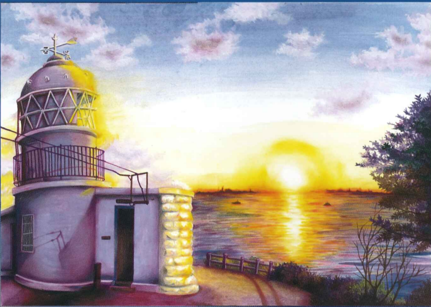
2022 海上保安庁長官賞