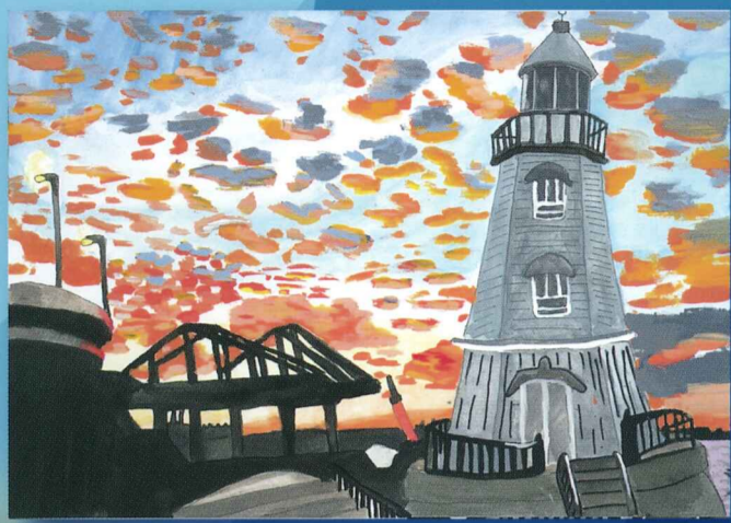
2022 小学生高学年金賞